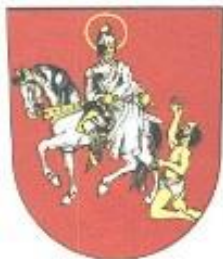
Město Hrochův Týnec