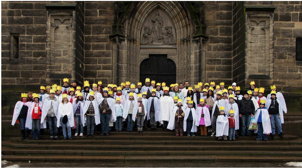
koledníci TS 2013