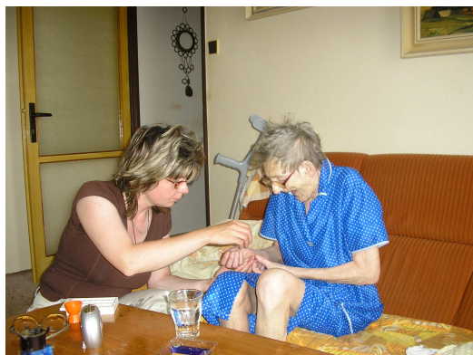
práce v terénních službách