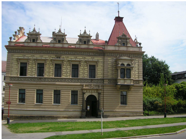
sídlo Farní charity na Školním náměstí